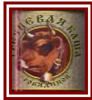
כשר בהשגחת הרבנות י"ם