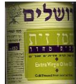
זיוף בד"ץ נוה ציון

בברכת התורה והארץ, רפי יוחאי מנהל היחידה הארצית לאכיפת חוק איסור הונאה בכשרות