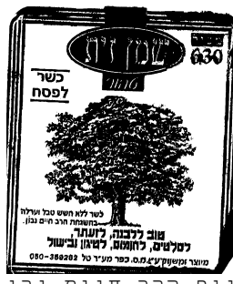
זיוף הרב חיים נבון