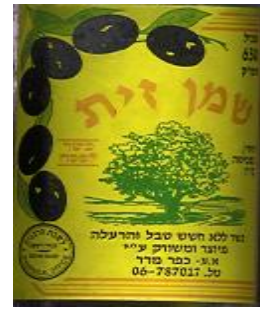
זיוף רבנות זכרון יעקב