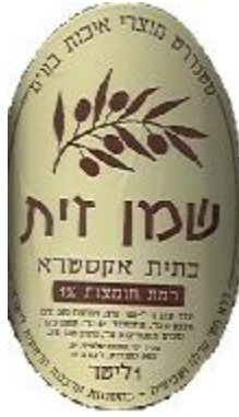
זיוף הרה"ר לישראל