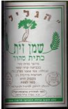
זיוף בד"ץ המכונה "קהילות היראים"

מצ"ב מס' דוגמאות של שמנים מזוייפים אשר נתפסו ע"י פקחי היחידה הארצית