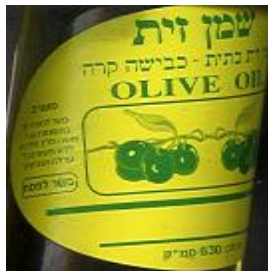
זיוף הרב משה פרץ