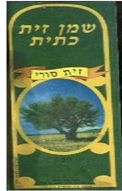
זיוף הרב משה טיירי