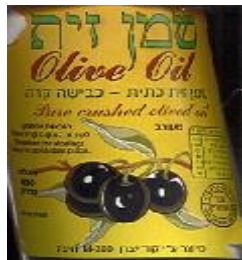
זיוף רבנות חיפה