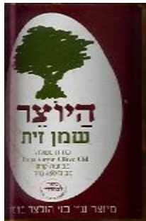
זיוף הרב אונגר